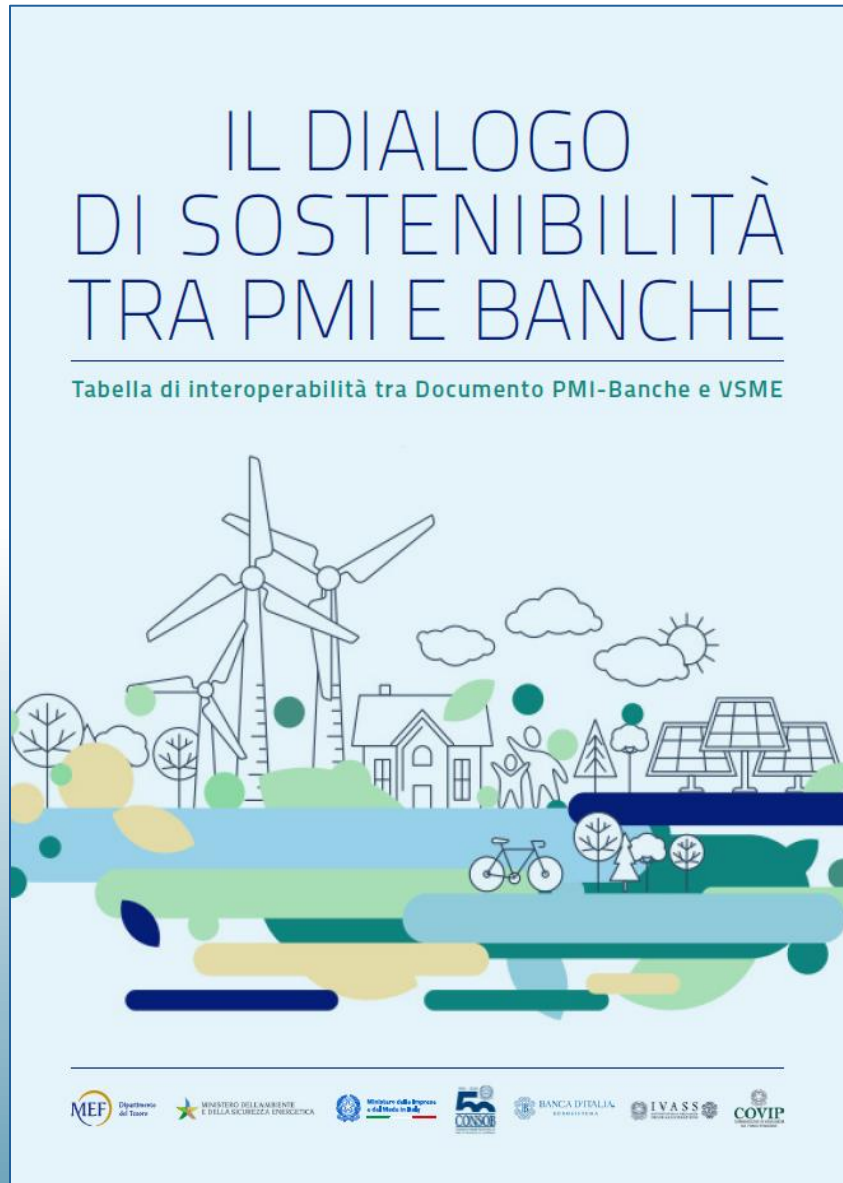
Tabella di interoperabilità

Non amplia perimetro né obblighi ma funge da supporto operativo rendendo più chiaro il raccordo tra livello nazionale ed europeo.